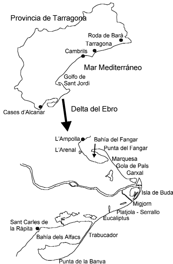
FIGURA 1. Mapa de la zona de estudio. FIGURE 1. Map of the study area.

se intentó recopilar toda la información posible, obteniéndose para este período 98 citas. Para localizar las citas se utilizó la cartografía UTM con una cuadrícula de 10 x 10 km superpuesta.